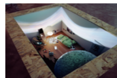
Deine Raumkapsel (Din rymdkapsel), 2006 Trälåda, en roterande projektor, ljudanläggning, en säng, en stol, tapet och diverse objekt i en skala av 1:6; måne och stjärnor. Ca. 10 min video loop, ca. 16 min audio loop.

På väggen bakom visas en audiovideoinstallation där vi följer Pipilotti Rist i närbild då hon funderar kring relationer och den tvåsamhet människan verkar sträva efter. Monologen avspelar sig under en bilfärd med ett schweiziskt landskap som glider förbi i bakgrunden.