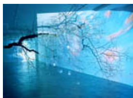
Apple Tree Innocent On Diamond Hill (Äppelträd oskyldigt på diamantkullen), 2003. Videoinstallation, urval objekt från The Innocent Collection , 1985 – approx. 2032 (Den oskyldiga samlingen, 1985 – ca. 2032). Ca. 14 min. video loop.

Utställningen på Magasin 3 är Rists första separatutställning i Skandinavien och inkluderar centrala arbeten i hennes konstnärskap såväl som två helt nyproducerade verk.