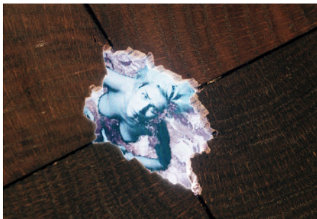
Selbstlos im Lavabad (Osjälvvisk i lavabadet), 1994 Audiovideoinstallation. LCD monitor installerad under golvet i trappan. Ca. 6 min. video loop.

Verket som gömmer sig i trappan ned till bottenvåningen heter Selbstlos im Lavabad och talar till vår medmänskliga sida – att vilja hjälpa varandra och vara förlåtande både gentemot andra och oss själva. Pipilotti Rist beskriver i egna ord: "Det är viktigt för mig att människor är varsamma mot varandra och att man ömsesidigt tar varandra på allvar. (...) När besökare upplever mina verk vill jag att de är mindre hårda mot sig själva. (...) Att uppmuntra en viss mildhet gentemot sig själv hör till mitt budskap." (ur publikationen Grattis! )