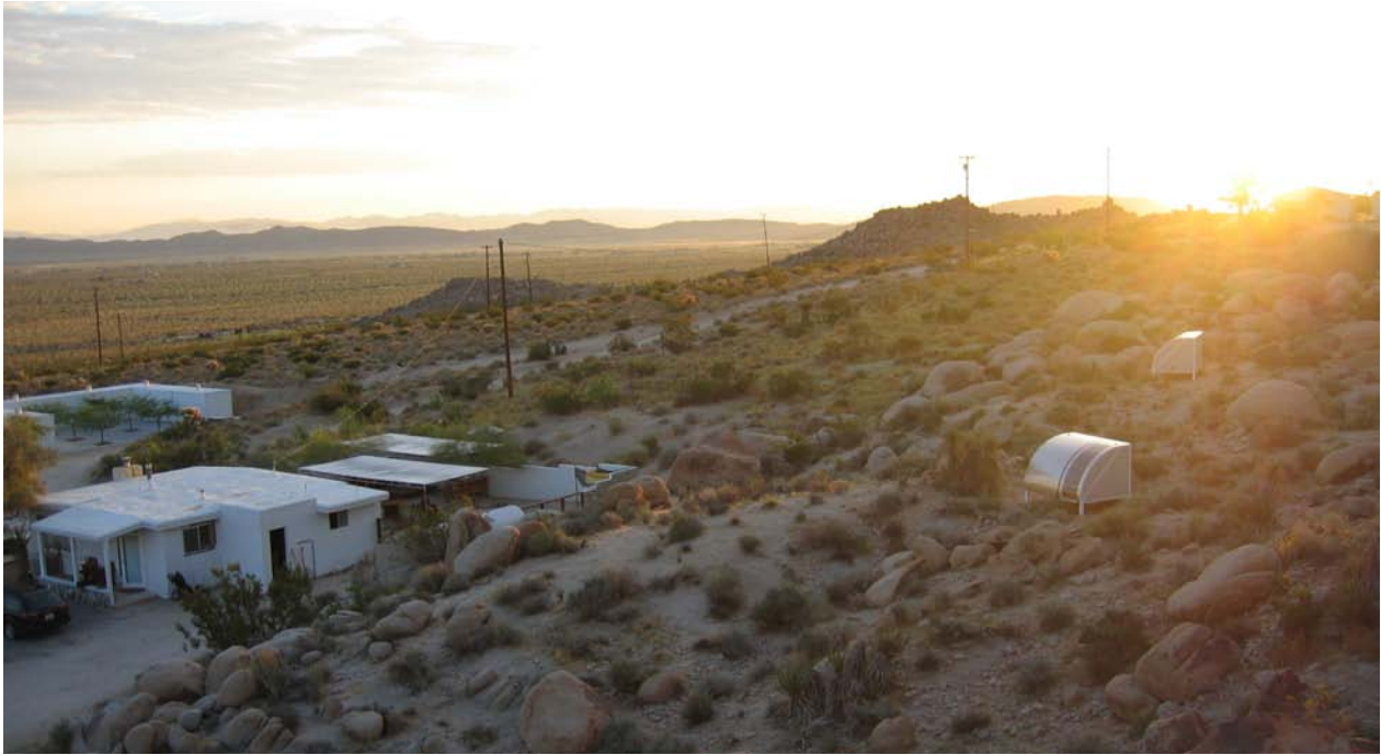
Andrea Zittel, A-Z West, 2004