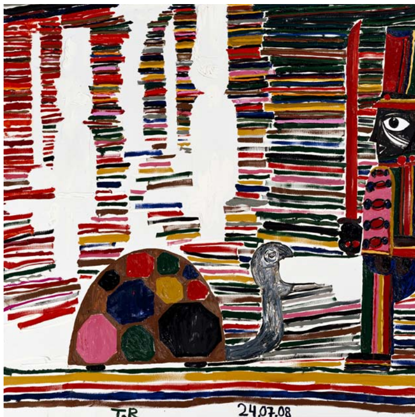
Vänster: Tal R, Hyacinth , 2008 Höger: Tal R, Fast Turtle March , 2008