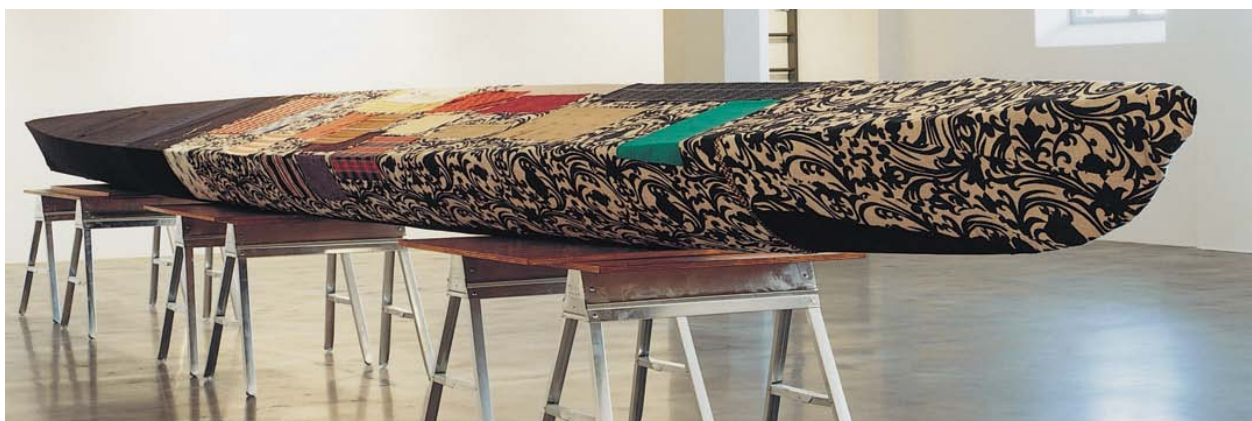
Cosima von Bonin, Item , 2001

Bygg ditt eget museum via facebook. Vad skulle du visa? http://www.intel.com/museumofme/r/index.htm