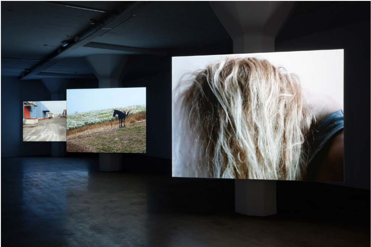
Vänster: Marijke van Warmerdam, Wind , 2010 Mitten: Marijke van Warmerdam, Wave , 2006 Höger: Marijke van Warmerdam, Blondine , 1995