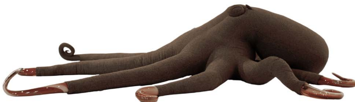
Cosima von Bonin, Seasons in the Abyss , 2006

Cosima von Bonins verk har tidigare presenterats på Magasin 3 i utställningen Freeport 2001 , To be continued... 2007 och i utställningen BETWIXT , 2008.