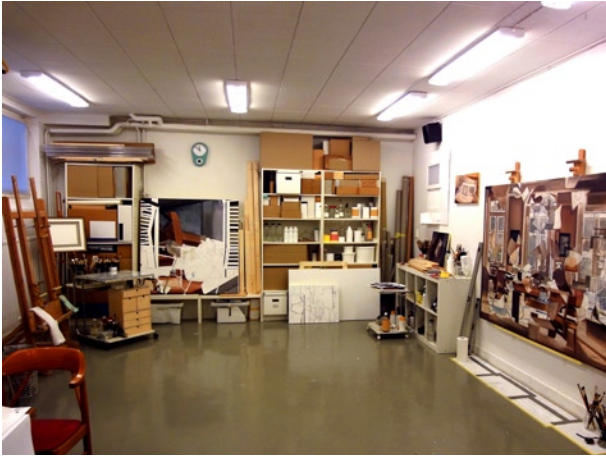
Carl Hammouds ateljé, 2010